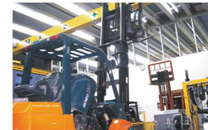
充実した設備の工場